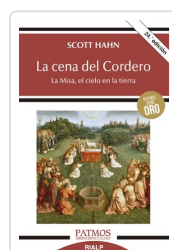
La cena del Cordero Hahn , Scott