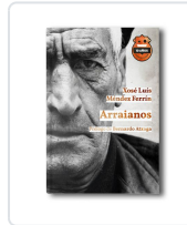
Arraianos. Ed. 10 Aniversario Méndez Ferrín, Xosé Luís