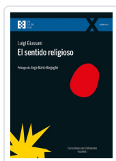
El sentido religioso Giussani, Luigi