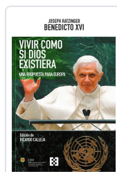
Vivir como si Dios existiera Ratzinger (Benedicto XVI), Joseph