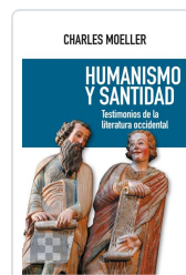
Humanismo y santidad Moeller, Charles