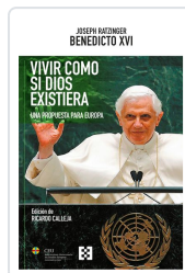
Vivir como si Dios existiera Ratzinger (Benedicto XVI), Joseph