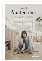
Austeridad Gala, Loreto