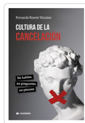
Cultura de la cancelación Bonete Vizcaíno, Fernando