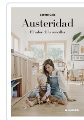
Austeridad Gala, Loreto