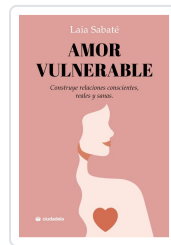
Amor vulnerable Sabaté, Laia