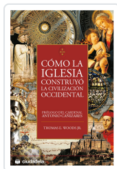
Como la Iglesia construyó la civilización occidental Woods, Thomas E.