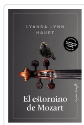
El estornino de Mozart Lynn Haupt, Lyanda