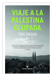
Viaje a la Palestina ocupada Hazan, Eric