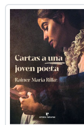
Cartas a una joven poeta Rilke, Rainer