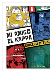
MI AMIGO EL KAPPA 1 MIZUKI, SHIGERU Mizuki, Shigeru