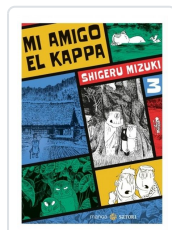
MI AMIGO EL KAPPA 3 MIZUKI, SHIGERU