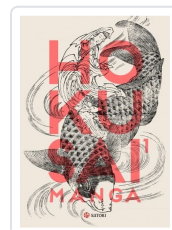
HOKUSAI MANGA #1