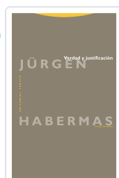
VERDAD Y JUSTIFICACIÓN (3ª REIMPR.) HABERMAS, JÜRGEN