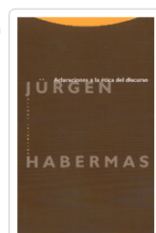
ACLARACIONES A LA ÉTICA DEL DISCURSO (1R) HABERMAS, JÜRGEN