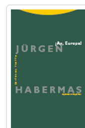
AY, EUROPA! (1ª REIMPRESIÓN) HABERMAS, JURGEN