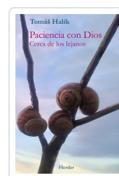
Paciencia con Dios Tomás Halik