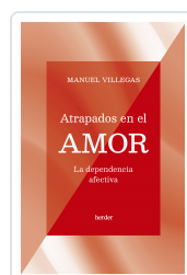
ATRAPADOS EN EL AMOR VILLEGAS BESORA , MANUEL