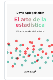
El arte de la estadística Spiegelhalter, David