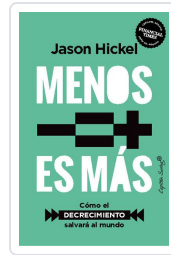
Menos es más Hickel, Jason