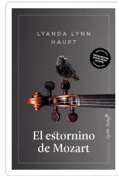
El estornino de Mozart Lynn Haupt, Lynda