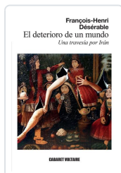
El deterioro de un mundo Désérable, François-Henri