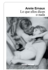
Lo que ellos dicen o nada Ernaux, Annie