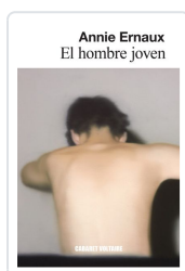
Annie Ernaux El hombre joven Ernaux, Annie