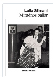
Leila Slimani Miradnos bailar Slimani, Leila