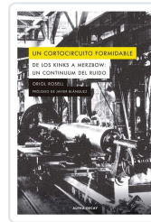
UN CORTOCIRCUITO FORMIDABLE Rosell Costa, Oriol