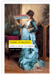
Sobre la belleza. Entre la Venus y el Ciborg Naïef Yehya