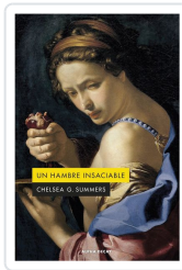
UN HAMBRE INSACIABLE Summers, Chelsea G.