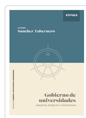
Gobierno de Universidades Sánchez-Tabernero, Alfonso