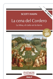
La cena del Cordero Hahn, Scott