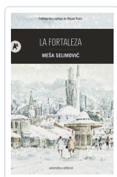
La fortaleza Selimovic, Meša