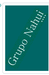
Infancia Gorki, Maksim