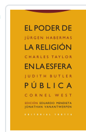
EL PODER DE LA RELIGIÓN EN LA ESFERA PÚBLICA HABERMAS, JÜRGEN Y OTROS