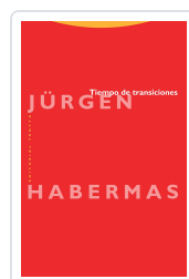
TIEMPO DE TRANSICIONES (1ª REIMPRESIÓN) HABERMAS, JÜRGEN