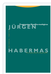
FRAGMENTOS FILOSÓFICO-TEOLÓGICOS (1ª R.) HABERMAS, JÜRGEN