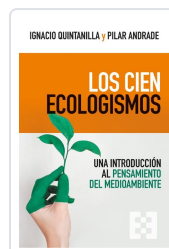
Los cien ecologismos Quintanilla Navarro, Ignacio;Andrade Boué, Pilar