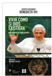
Vivir como si Dios existiera Ratzinger (Benedicto XVI), Joseph