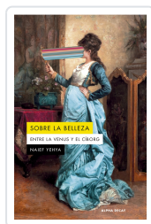
Sobre la belleza. Entre la Venus y el Ciborg Naief Yehya