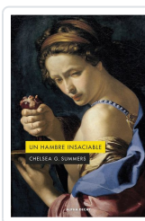
UN HAMBRE INSACIABLE Summers, Chelsea G.