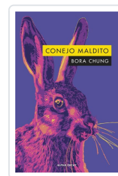
CONEJO MALDITO Chung, Bora