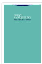
Derechos a la fuerza Zagrebelsky, Gustavo