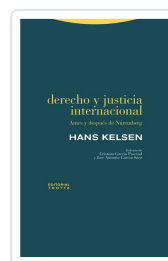
Derecho y justicia internacional Kelsen, Hans