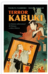
Terror Kabuki Tsuruya Namboku IV