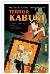
Terror Kabuki Tsuruya Namboku IV