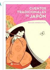
CUENTOS TRADICIONALES DE JAPÓN GORDON SMITH, RICHARD