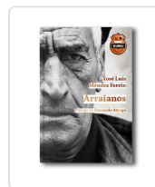
Arraianos. Ed. 10 Aniversario Méndez Ferrín, Xosé Luís