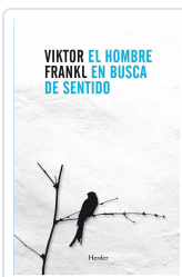
El hombre en busca de sentido Frankl, Viktor Emil