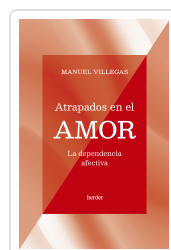
ATRAPADOS EN EL AMOR VILLEGAS BESORA, MANUEL