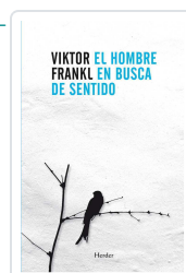
El hombre en busca de sentido Frankl, Viktor Emil