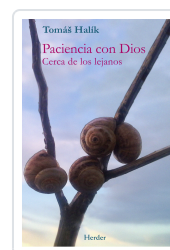
Paciencia con Dios Tomás Halik