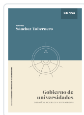
Gobierno de Universidades Sánchez-Tabernero, Alfonso