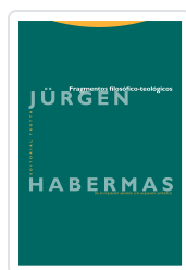
FRAGMENTOS FILOSÓFICO-TEOLÓGICOS (1ª R.) HABERMAS, JÜRGEN