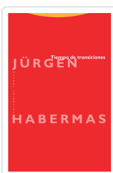
TIEMPO DE TRANSICIONES (1ª REIMPRESIÓN) HABERMAS, JÜRGEN