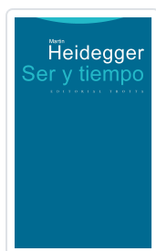
Ser y tiempo Heidegger, Martin