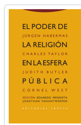
EL PODER DE LA RELIGIÓN EN LA ESFERA PÚBLICA HABERMAS, JÜRGEN Y OTROS