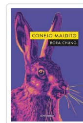
CONEJO MALDITO Chung, Bora