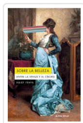
Sobre la belleza. Entre la Venus y el Ciborg Naief Yehya