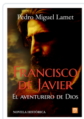
Francisco de Javier, el aventurero de Dios Lamet, Pedro Miguel