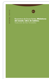
Miniaturas del mundo Santos, Boaventura de Sousa