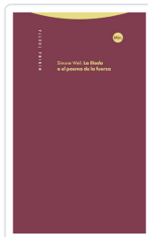
La 'Iliada' o el poema de la fuerza Weil, Simone