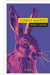
CONEJO MALDITO Chung, Bora