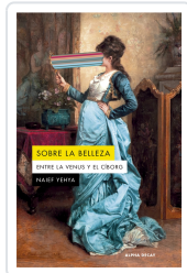
Sobre la belleza. Entre la Venus y el Ciborg Naief Yehya