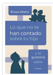
Lo que no te han contado sobre tu hijo y te gustaría saber Utrera, Kiruca