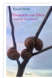
Paciencia con Dios Tomás Halik