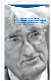
ISRAEL O ATENAS (2ª ED.) HABERMAS, JÜRGEN