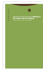
Miniaturas del mundo Santos, Boaventura de Sousa