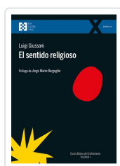
El sentido religioso Giussani, Luigi