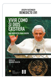
Vivir como si Dios existiera Ratzinger (Benedicto XVI), Joseph