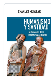
Humanismo y santidad Moeller, Charles