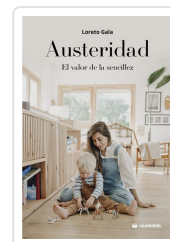
Austeridad Gala, Loreto