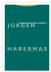
FRAGMENTOS FILOSÓFICO-TEOLÓGICOS (1ª R.) HABERMAS, JÜRGEN