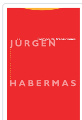
TIEMPO DE TRANSICIONES (1ª REIMPRESIÓN) HABERMAS, JÜRGEN