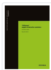
OFFICIUM SEGÚN EL DERECHO CANONICO Viana Tomé, Antonio