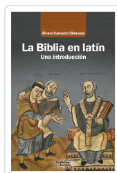
La Biblia en latín Cancela Cilleruelo, Álvaro