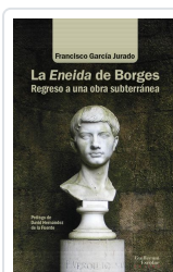
La Eneida de Borges García Jurado, Francisco