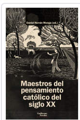
Maestros del pensamiento católico del siglo XX