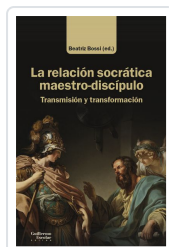
La relación socrática maestro-discípulo