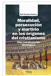
Moralidad, persecución y martirio en los orígenes del cristianismo González Salinero, Raúl