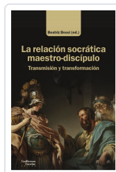
La relación socrática maestro-discípulo