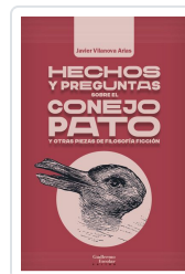
Hechos y preguntas sobre el conejo pato y otras piezas de filosofía ficción Vilanova Arias, Javier