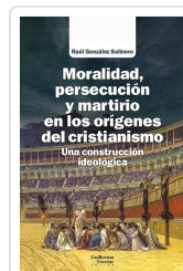
Moralidad, persecución y martirio en los orígenes del cristianismo González Salinero, Raúl