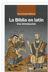
La Biblia en latín Cancela Cilleruelo, Álvaro