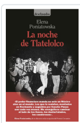
La noche de Tlatelolco Poniatowska Amor, Elena