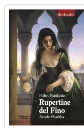
Rupertine. Novela filosófica Mainländer, Philipp