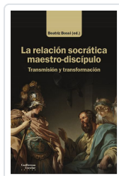
La relación socrática maestro-discípulo