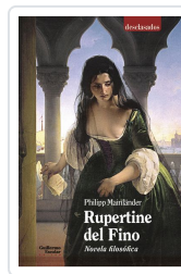
Rupertine. Novela filosófica Mainländer, Philipp