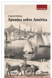
Apuntes sobre América Dickens, Charles