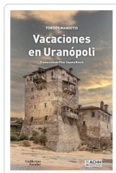
Vacaciones en Uranópolis Maniotis, Yorgos