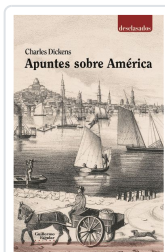
Apuntes sobre América Dickens, Charles